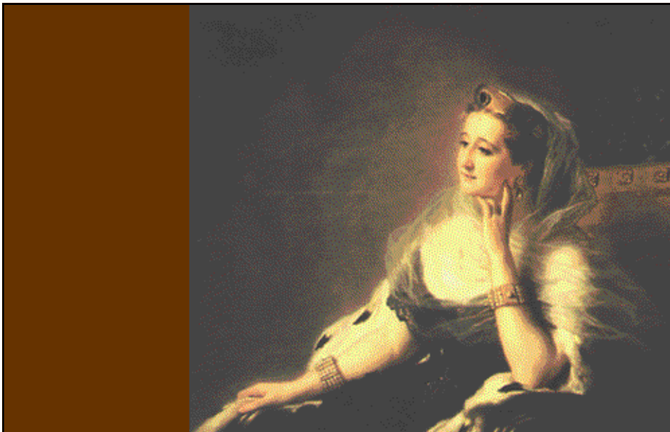
NOBLEZA Y BURGUESÍA